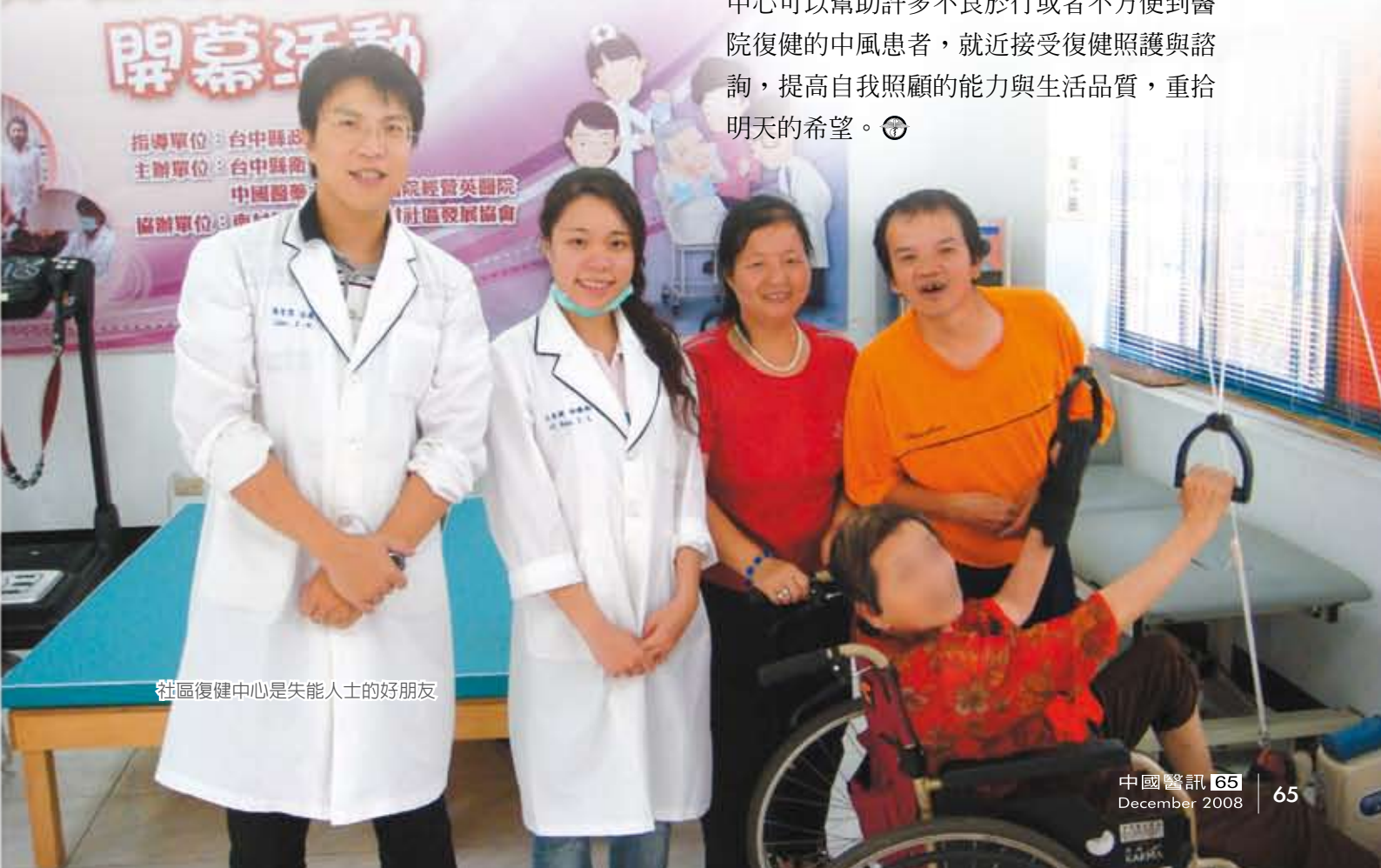
社區復健中心是失能人士的好朋友

中風的老人家如果整天待在家裡，沒有積極復健，不但對病情沒有幫助，也容易產生憂鬱、消極的想法，社區長期照護復健中心可以幫助許多不良於行或者不方便到醫院復健的中風患者，就近接受復健照顧與諮詢，提高自我照顧的能力與生活品質，重拾明天的希望。◎