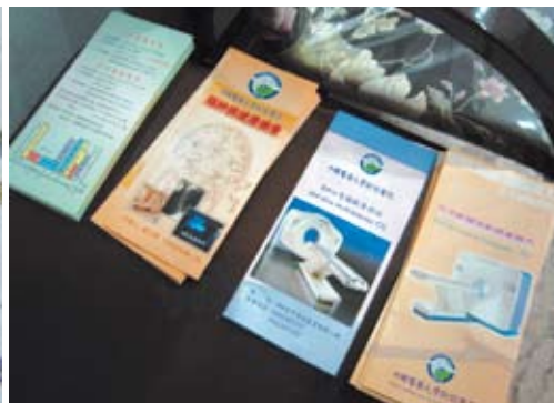
徐醫師診所擺滿本院的衛教單張