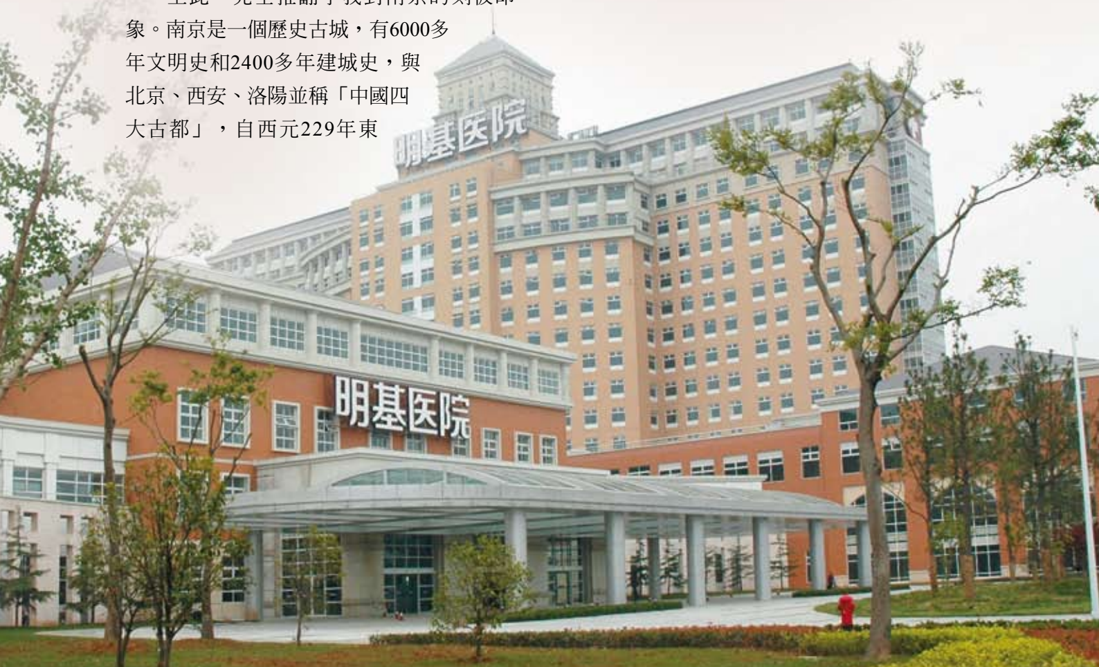
明基醫院完工後的優雅風貌

南京屬於亞熱帶季風氣候，具有冬冷夏熱、四季分明的特點，年降雨量在1000毫米以上。夏季極端高溫，最高值為40.7℃，冬季最冷溫度為零下8℃，會降雪。