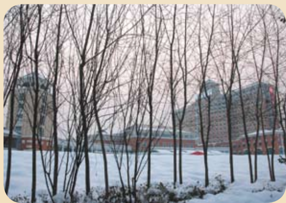
明基醫院前的雪景，美吧！

到了大門口，一片水泥造的臨時圍牆，滿是塗鴉，圍牆後緊接著被一輛輛卡車壓過的爛泥巴地，雨後更顯得泥濘。走了幾步，步伐愈來愈沈重，原來鞋子已裹上厚厚的一層泥巴。這時的明基醫院只有主建築已完成，其餘大部分都正在趕工當中。室內就好多了，因為泥地沒被大卡車壓過，所以路況不像外頭那麼糟。工程隊的工頭一見我們就立刻送上安全帽、工作背心，並附上礦工用的頭戴式照明設備，就這樣，在頭燈、地圖的輔助下，我在室內「翻山越嶺」的探索我所負責的區域。離開時，到了室外，天氣冷，心更冷，因為我們必須在限時內完成幾