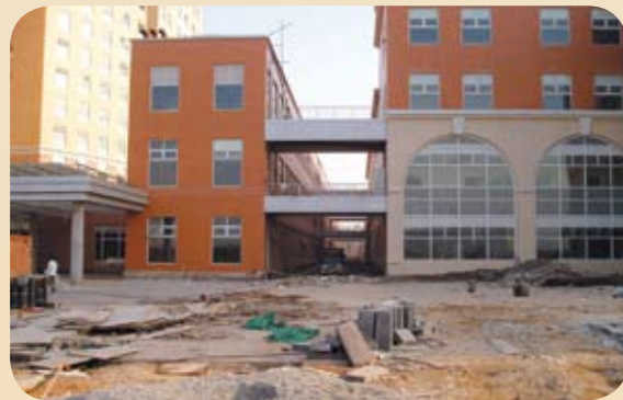
明基醫院完工前，處處舉步維艱

數天之後，11月初的南京，已可感受到秋的寒意，尤其當天空飄起小雨，總讓來自四季如春寶島的我直打哆嗦。宿舍外有一個大型的溫度計看板，從這個看板每天都可以看到溫度持續往下降，而螢幕上的數字可是