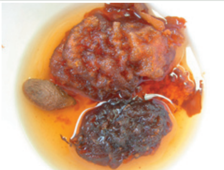
胖大海以熱水沖泡後，體積變大數倍