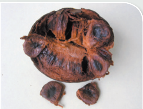
剝開羅漢果，質鬆如海綿，有焦糖味

羅漢果味甘性涼，善清肺熱、化痰飲，且可利咽止痛，常用於治咳嗽、氣喘，可單味煎服，或配伍百部、桑白皮同用。也用於生津潤腸通便，治腸燥便秘，可配合火麻仁、桃仁等潤腸藥同用。