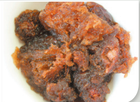
胖大海膨大後撐破種皮，很像海綿狀海藻