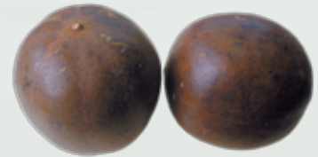
羅漢果外表似毛茸觸感，皮薄質脆易碎

葫蘆科植物羅漢果 Mormordica grosvenorii SWINGLE 的果實，主產於廣西。秋季果熟時採摘，用火烘乾，刷毛，生用。以個大、完整、搖之不響、色黃褐的品質最佳。