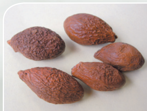
胖大海狀如深褐色橄欖

胖大海甘寒質輕，能清宣肺氣，化痰利咽開音。常單味泡服，亦可配桔梗、甘草等同用。治風熱外襲、肺熱鬱閉所致乾咳無痰、咽喉燥痛、聲音嘶啞者，可單味泡服，或配薄荷、蟬蛻等同用。若肺熱較重，咽痛甚者，可配金銀花、玄參等同用。若肺熱傷津而致咳嗽、大便乾結，常配桑白皮、地骨皮等同用。也可用於治療燥熱便秘、頭痛目赤，能潤腸通便，清泄火熱，或配清熱瀉下藥以增強藥效。