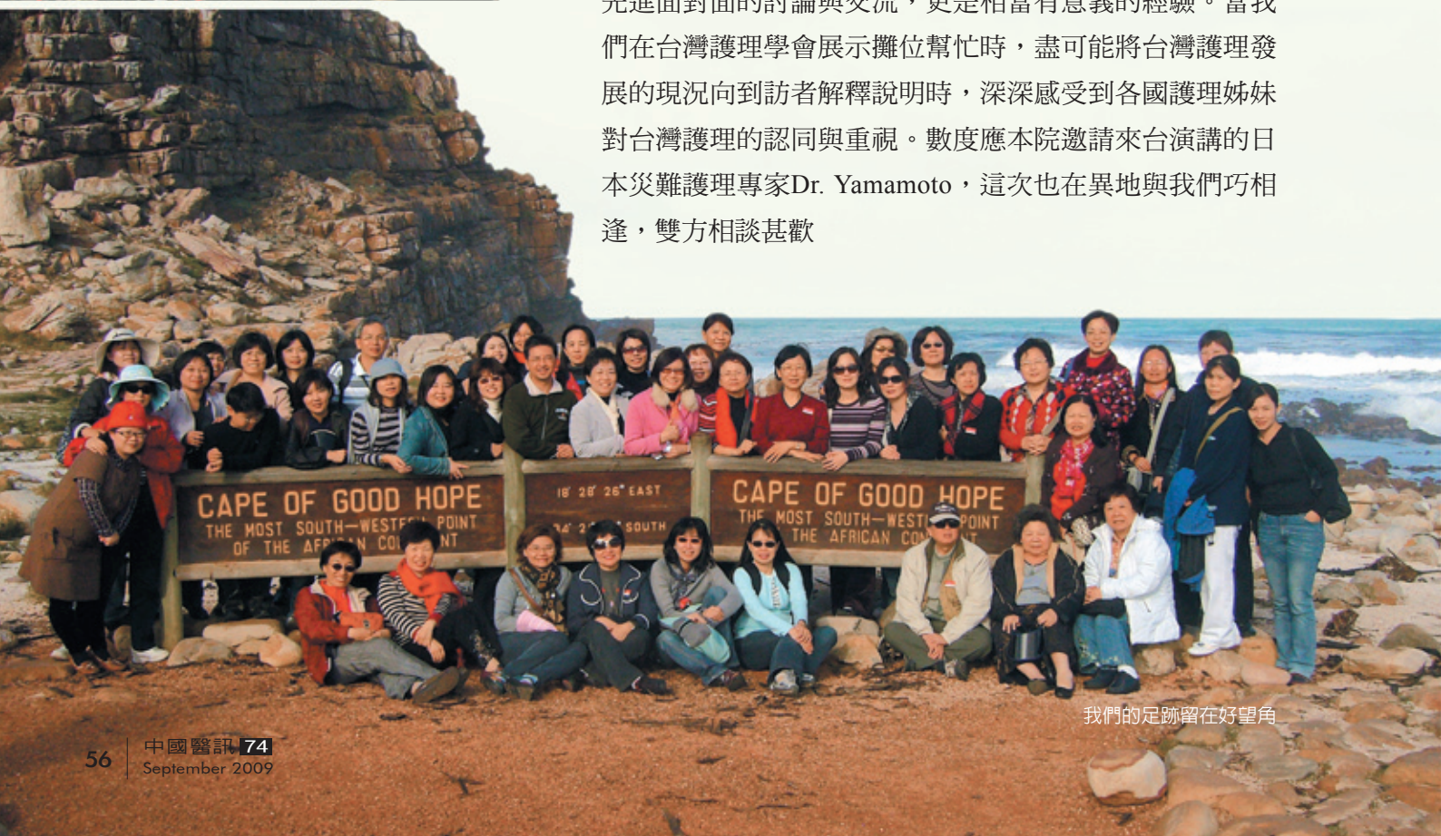
我們的足跡留在好望角

會議期間，我們穿梭在會場中，聆聽各國學者的專題演講與口頭論文發表，開拓專業視野，並學習發表論文的技巧。在各國護理姊妹的海報發表區，發現不少有趣新穎的主題，是學習觀摩很好的機會，也激發對未來研究的許多想法。當然，在自己發表論文的過程中，與國外護理先進面對面的討論與交流，更是相當有意義的經驗。當我們在台灣護理學會展示攤位幫忙時，盡可能將台灣護理發展的現況向到訪者解釋說明時，深深感受到各國護理姊妹對台灣護理的認同與重視。數度應本院邀請來台演講的日本災難護理專家Dr. Yamamoto，這次也在異地與我們巧相逢，雙方相談甚歡