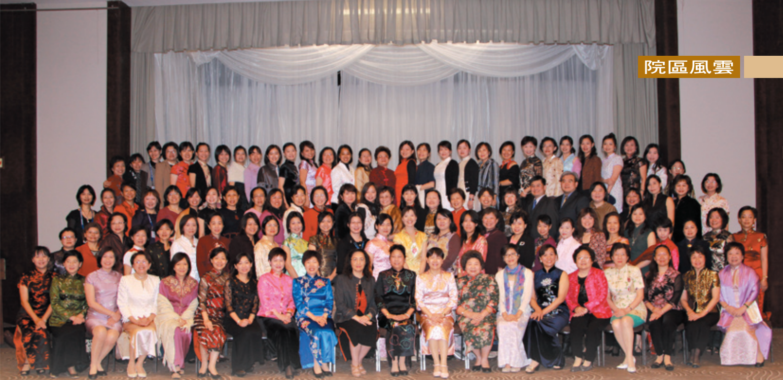
出席晚宴的「台灣人」眾志成城

南非，一個遙遠的國度！南非原住民的熱情，豐富的物產與天然資源，在在令人讚嘆。約翰尼斯堡、開普敦、德班各有不同的城市風貌；好望角讓我們百聞不如一見；在非洲野生動物園被象群包圍，更是難得的驚奇之旅。此外，要特別感謝當地僑胞的盛情，從抵達南非機場時的協助禮遇通關、方便兌換南非幣，到招待品嚐各種中式、台式、日式的豐盛晚宴，均使我們這群「異鄉人」備感溫馨。