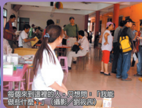
每個來到這裡的人，只想問：「我能做些什麼？」

眼中看見無比的震驚與不可置信。曾經被譽為世外桃源的六龜，如今竟是如此的殘破！貨運卡車的顛簸前進，路不成路的泥濘碎石，伴隨著路旁分不清界線的滾滾濁流，夾雜著載浮載沉的漂流木，格外顯得怵目驚心。這時又聽說多了3個走山形成的堰塞湖，我抬頭看看烏雲密佈的天空，只能默默地祈禱：「老天爺，請不要再下雨了吧！」