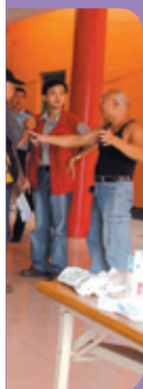
學長變成被媒體包圍的大明星