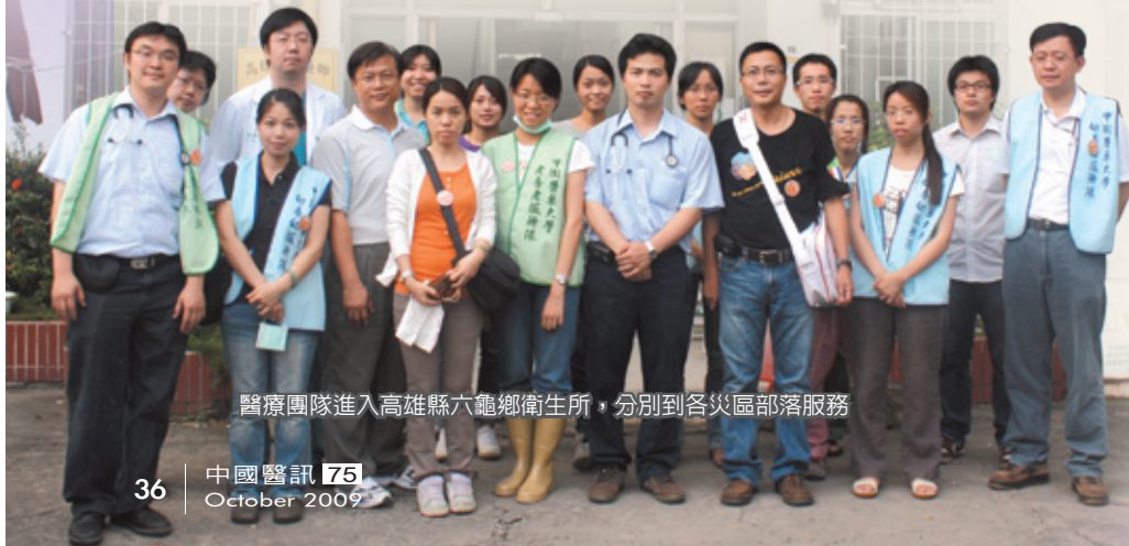
醫療團隊進入高雄縣六龜鄉衛生所，分別到各災區部落服務

就診患者開口第一句話常常就是他們的家不見了，連夜逃出時不小心被木枝、鐵絲刺傷。從患者的傷口不難看出逃離時的倉皇，化膿的化膿，紅腫的紅腫，除了再三提醒惡化時要注意的症狀與就醫途徑，更多的是給予情緒上的安撫與鼓勵。老人家多見慢性病藥物中斷，出現高血壓或糖尿病的相關不適，或是長期泡水造成的皮膚病，紅腫、潰爛在在反映出後續安頓的衛生問題與疫病防治的迫切性。