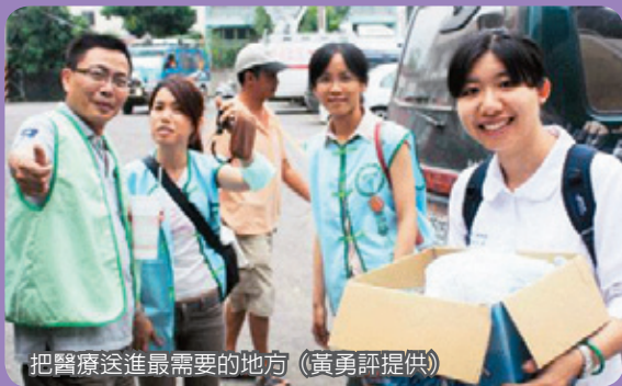
把醫療送進最需要的地方 (黃勇評提供)