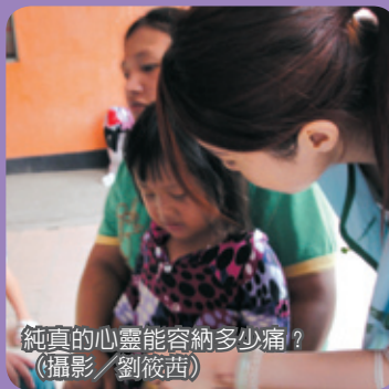
純真的心靈能容納多少痛?