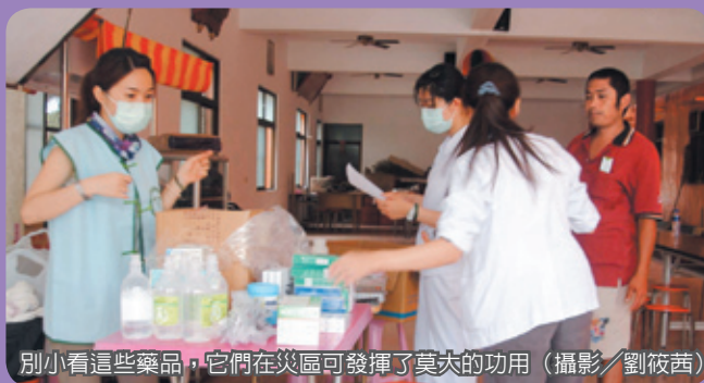
別小看這些藥品，它們在災區可發揮了莫大的功用

患者失眠的問題也很普遍，我們認真傾聽著，希望他們的壓力能夠隨著訴說而得到釋放。小朋友則多因被風吹雨淋或飲食的影響，出現咳嗽、打噴嚏、發燒、吐瀉等現象，一雙雙純真的眼睛，有惶恐，也有好奇，對於大自然的無情，他們的體認不多，但相較於大人的悲傷，卻更加令人鼻酸。