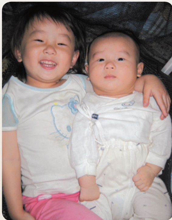
■ 我們都是喝母乳長大的喔！

產後兩個月回到職場，公司沒有女性員工餵母乳的先例，我不好意思向主管要求一天兩次的擠奶時間，只能利用中午休息時，便當隨便吃一吃，就到廁所去「籌措」女兒第二天的糧食，或者上班時間偷偷躲到廁所用手擠奶，把瓶子塞進口袋，再偷偷拿到公司的冰箱冷藏，還有同事笑我是母牛呢！下班後擔心漲奶，擔心母乳離開冰箱太久會不新鮮，也擔心灑文乖不乖，會不會讓外婆太