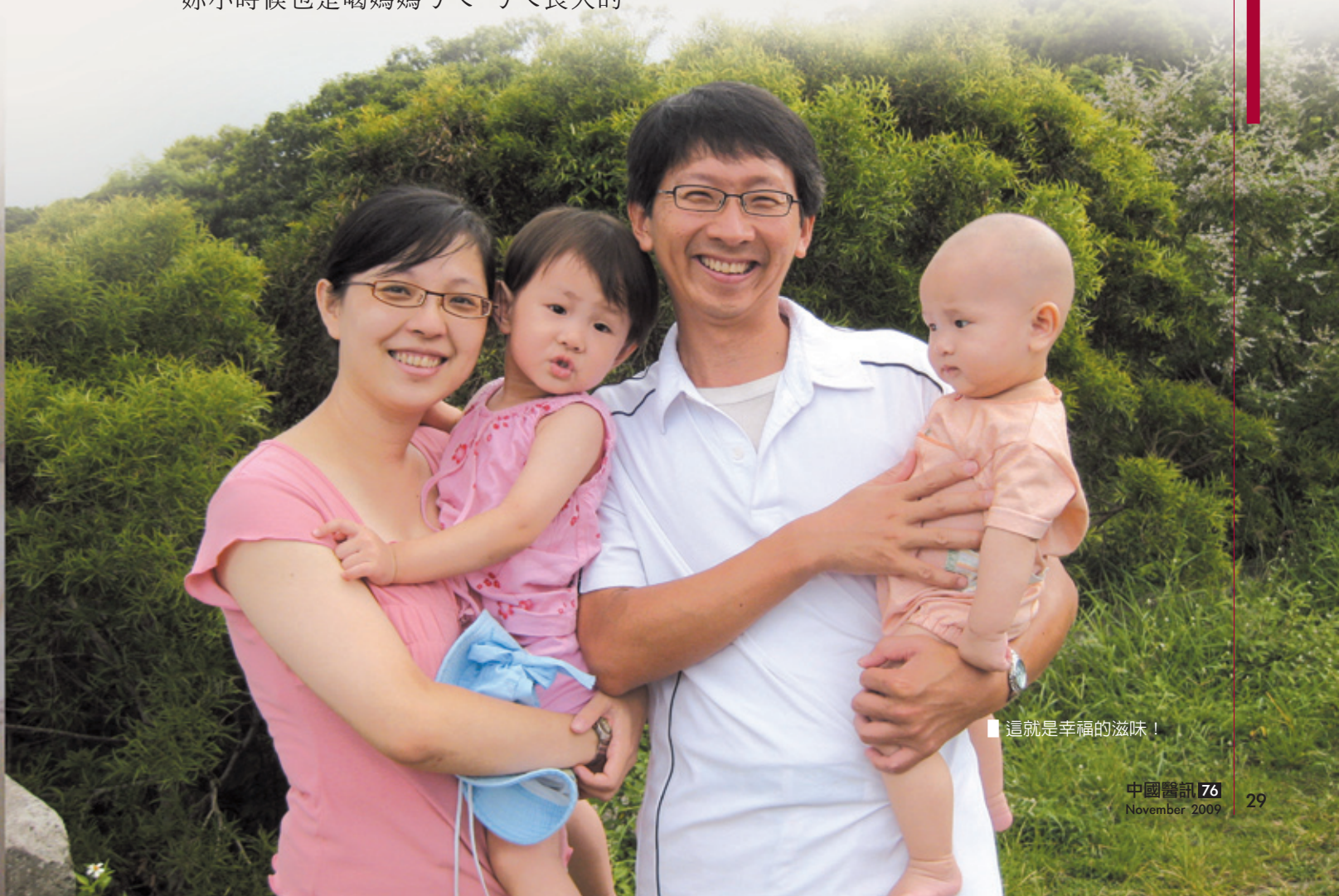
■這就是幸福的滋味！