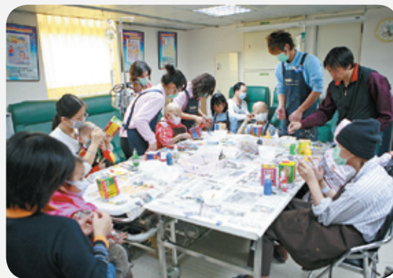
■ 每月必辦的藝術創作營

所有兒癌家庭幾乎都會面臨相同的境遇，為了讓他們一起面對、一起解決，並且交流照顧與治療的訊息、分享內心的感受、相互支持與鼓勵，本院兒童血液腫瘤科於民國88年成立了兒童癌症家長的支持團體「忘憂草兒童癌症家長聯誼會」，定期舉辦與疾病、治療、照顧、衛教、營養、社會心理適應與調適有關的講座與活動。相關活動包括：