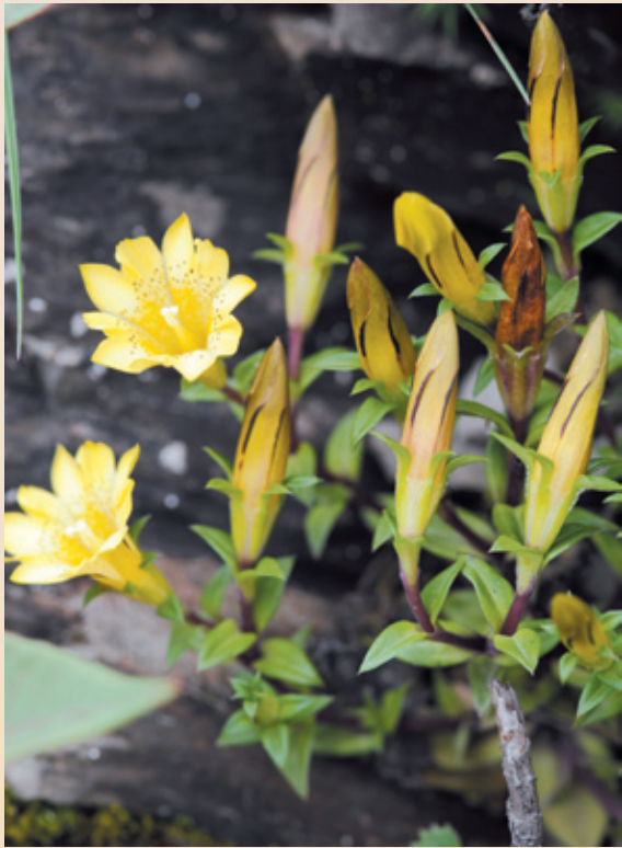
黃花龍膽草（黑斑龍膽草）