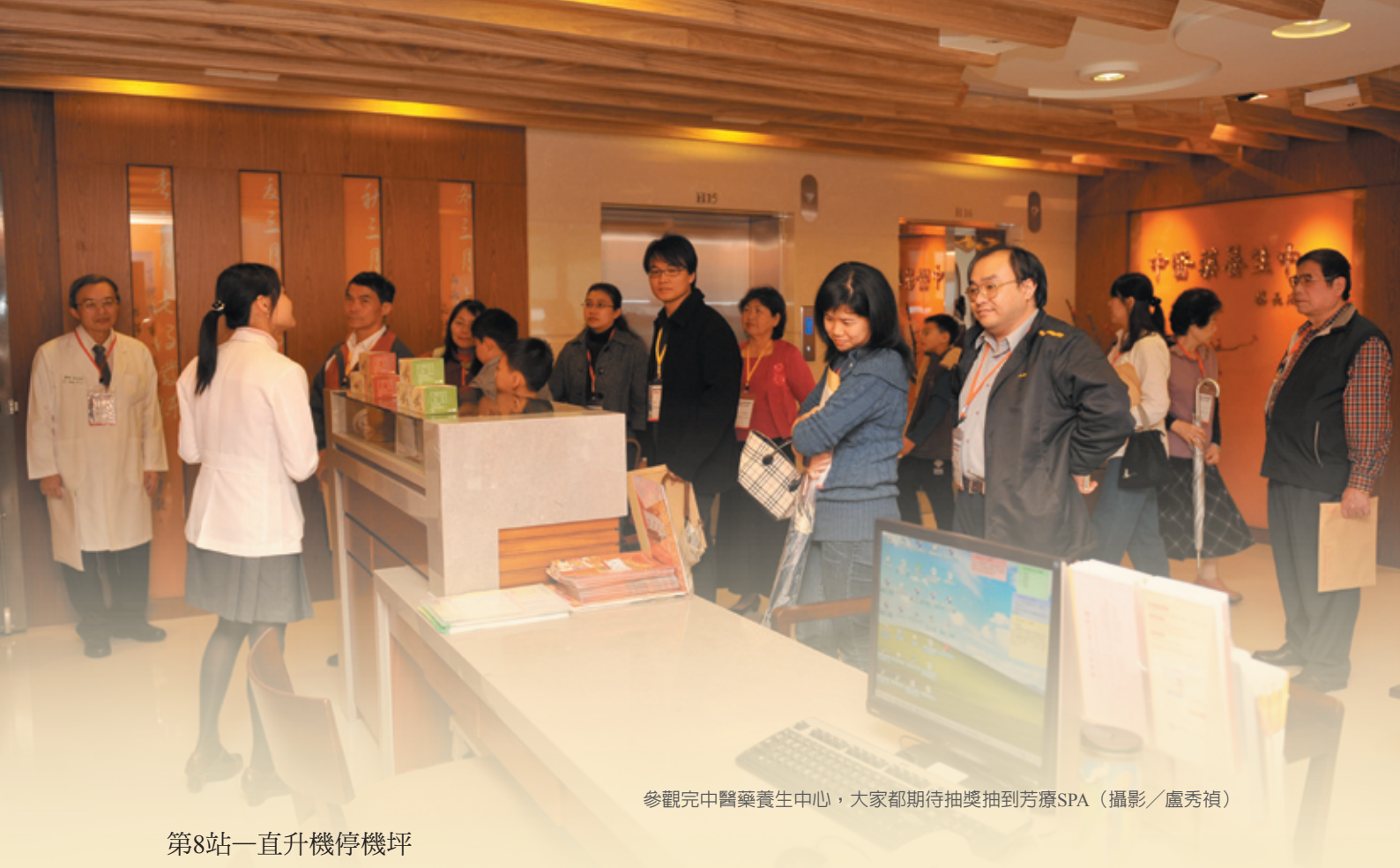
參觀完中醫藥養生中心，大家都期待抽獎抽到芳療SPA