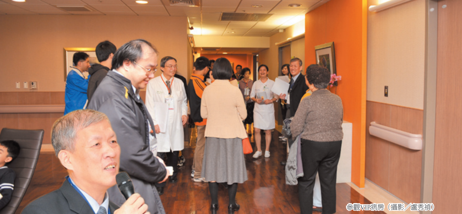
參觀VIP病房