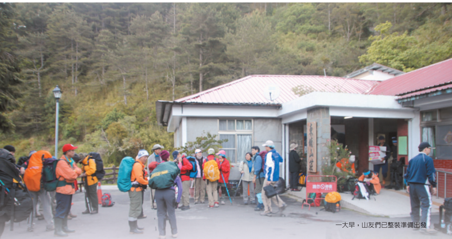
一大早，山友們已整裝準備出發

玉山是東北亞最高峰，海拔3952公尺，山徑維護良好，算是難度適中的熱門登山路線，也是台灣百岳最具指標性的一座高山，有些公司甚至有員工要登上玉山才能晉升的規定。登玉山最困難的不是體力問題，而是能不能順利抽中排雲山莊住宿，報名後，很幸運的，我們中籤了！再來就是行前準備，玉山國家公園管理處為了要降低登山客常有的高山症發生率，特別規定入山者不只要辦理入山證明，還要上課取得學習證書才能放行，想拿證書其實不難，只要透過網路上課，完成測驗，便可取得證書。