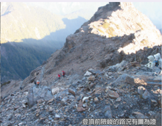
登頂前險峻的路況有圖為證

鐵籠般的網架下方停下腳步稍作休息，此時天已微亮，距離山頂還有500公尺，也是最危險與最難行走的一段。冷冽的寒風由山下往上吹，如針刺刀割般摧殘著每位攻頂者的意志，往峰頂的路，怎麼看也不像路，只能依賴著身旁的鋼柱及鐵鍊，一步一步沿著碎石向前，當終於喘著大氣登上峰頂，剎那間，心中充滿感動：「我終於登上玉山了！登上東北亞第一高峰！」