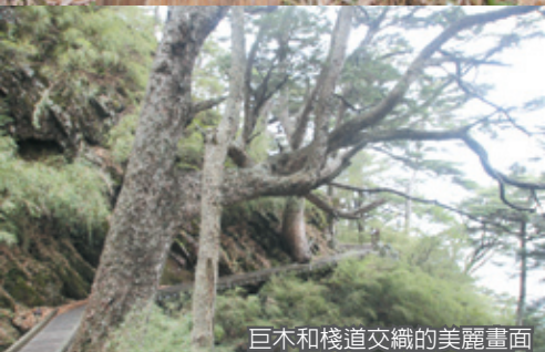
巨木和棧道交織的美麗畫面