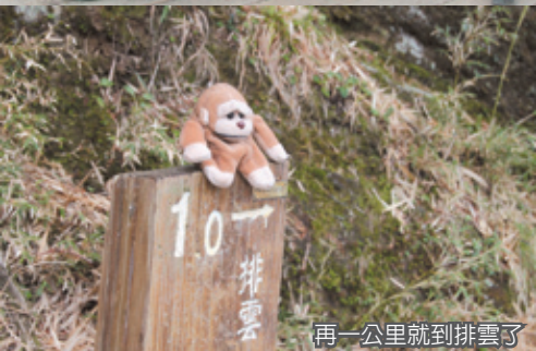
再一公里就到排雲了