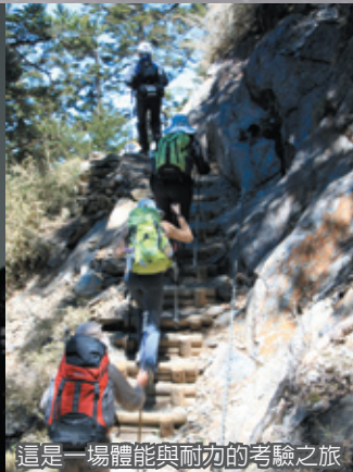
這是一場體能與耐力的考驗之旅