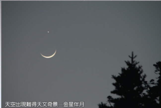
天空出現難得天文奇景—金星伴月