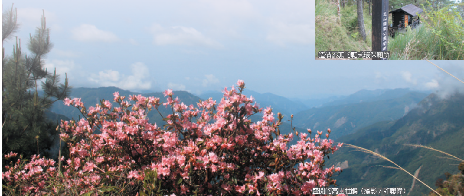
盛開的高山杜鵑