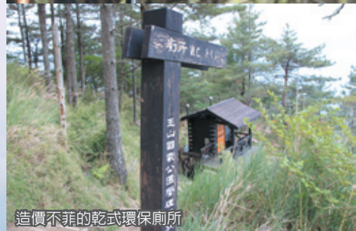
造價不菲的乾式環保廁所