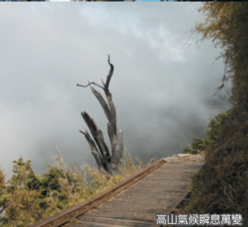
高山氣候瞬息萬變

從西峰觀景台到大峭壁的路段，大小碎石崎嶇不平，時而需依靠山壁鐵鍊、時而需留心腳踩踏點，雖僅1.7公里 卻花了一個多小時才走完。此時，轉個彎，走下幾級木梯，映入眼簾的竟是數層樓高的天然峭壁，陡峭高聳，駐足仰望猶如鬼斧神工劈出的平整壁面，不禁感嘆著自我的渺小。我們在這兒做個小休息，再繼續前行，山勢也逐漸進入3000公尺以上的高山，體力漸漸感到損耗，雙腿也有點不聽使喚，支撐著意志力的是路邊的里程標示樁，隨著每500公尺1支的標示，不斷向自己催眠：「快到了！就快到了！」終於看到前方的紅色屋頂，用最後僅存的餘力邁開步伐，下午兩點多，到達今天的落腳點「排雲山莊」。