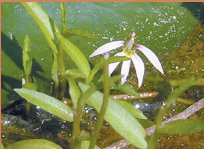
葉互生，無葉柄，葉子披針形，全緣。