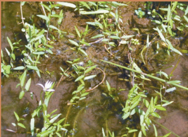
中央3裂片較淺，兩側裂片深裂。